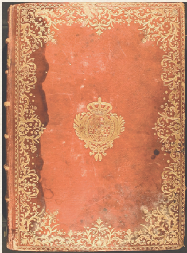
Figura 3. Encuadernación de estilo rococó de encajes. Sig. BUAP-BJML LG 392

Entre las encuadernaciones del siglo XVIII, destaca una de estilo rococó de encajes, realizada por Antonio de Sancha entre 1764 y 1790 (fecha de la muerte del encuadernador). Presenta una profusa decoración en dorado, de doble encuadramiento rectangular, el primero realizado con ruedas y el segundo compuesto mediante la estampación, hierro a hierro, de florones, tronquillos de un punto y de florecillas.