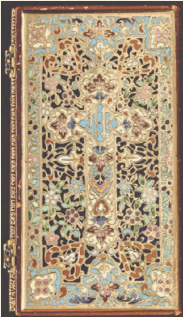
Figura 5. Encuadernación con esmaltes Sig. BUAP-BJML LG 47914

Como ejemplo de las encuadernaciones del siglo XX, se puede encontrar una realizada por Emilio Brugalla, el mejor encuadernador de la segunda mitad del siglo XX en España, que realizó sobre marroquín marrón oscuro en 1940 (figura 6) .