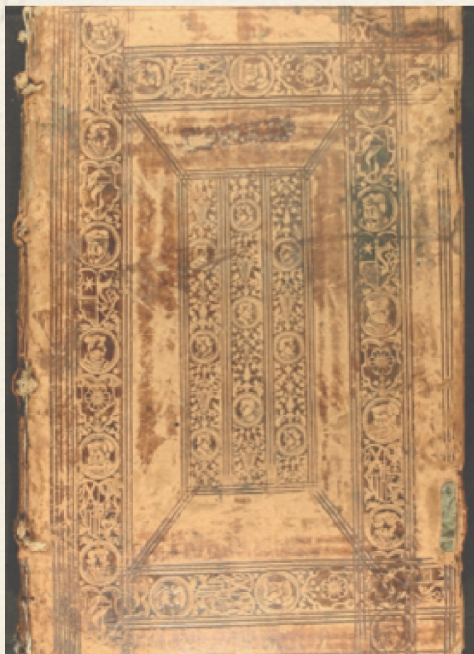
Figura 1. Encuadernación renacentista alemana con escudos en la rueda Sig. BUAP-BJML FO 6034

Como ejemplo de las encuadernaciones del siglo XVII y principios del XVIII, se muestra una encuadernación de estilo abanicos, procedente del Convento de San Francisco de Puebla (figura 2).