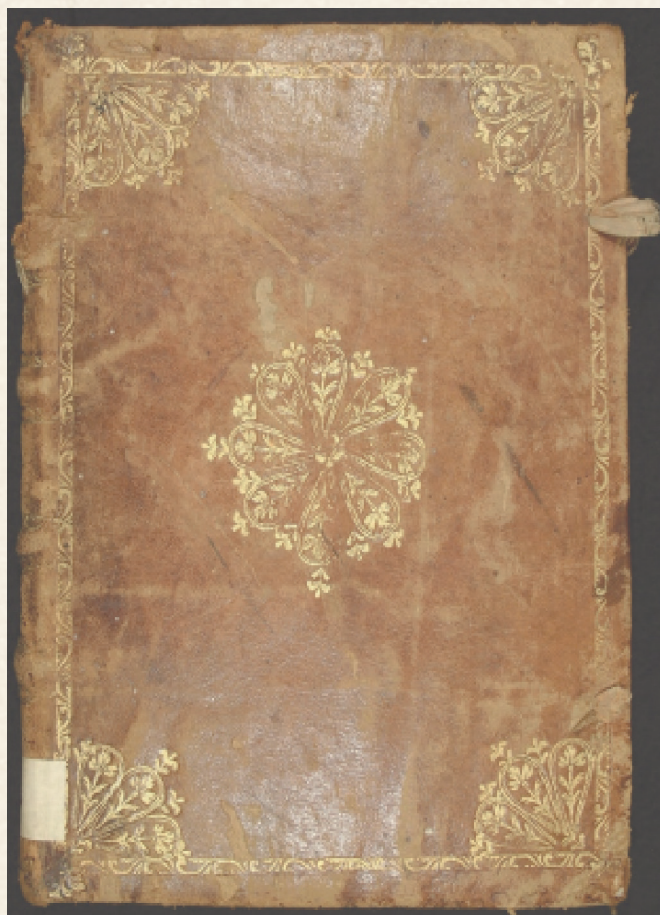
Figura 2. Encuadernación de abanicos Sig. BUAP-BJML FD 27889