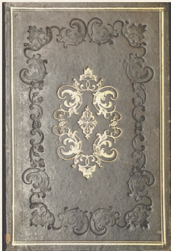
Figura 4. Encuadernación de estilo romántico con rocallas. Sig. BUAP-BJML LG 31924

En el siglo XIX, sobre todo a partir del segundo tercio del siglo, predominan las encuadernaciones románticas, dentro de las cuales encontramos las denominadas “a la catedral” con planchas que imitan fachadas, rosetones, balaustradas, arcadas de claustros y las llamadas rocallas isabelinas, es decir encuadernaciones con grandes planchas vegetales y florales en las esquinas, que se realizan mediante una pequeña rueda. Dentro de las románticas con rocallas, hemos seleccionado una encuadernación con planchas con motivos vegetales estilizados en las esquinas y en las bandas verticales y horizontales, todas ellas gofradas, y planchas, también estilizadas doradas en la parte central, todo ello enmarcado mediante dos hilos dorados, uno de ellos más grueso; la encuadernación fue realizada en el taller de Gutiérrez y Mancera en la Ciudad de México en el tercer cuarto del siglo XIX (figura 4).