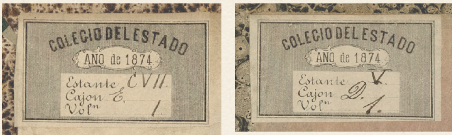
Figura 3. Ejemplos de etiquetas de localización impresas que datan de 1874, adheridas a guardas fijas anteriores. Referencias: 26530 y 29124.

Gracias al legado bibliográfico de Lafragua, al que se sumaron las obras adquiridas con su legado económico, la modernización del Colegio que ya impulsaban sus autoridades se manifestó en la secularización del conocimiento, la democratización del acceso al libro y la integración de nuevos géneros y saberes en el repertorio colegial.