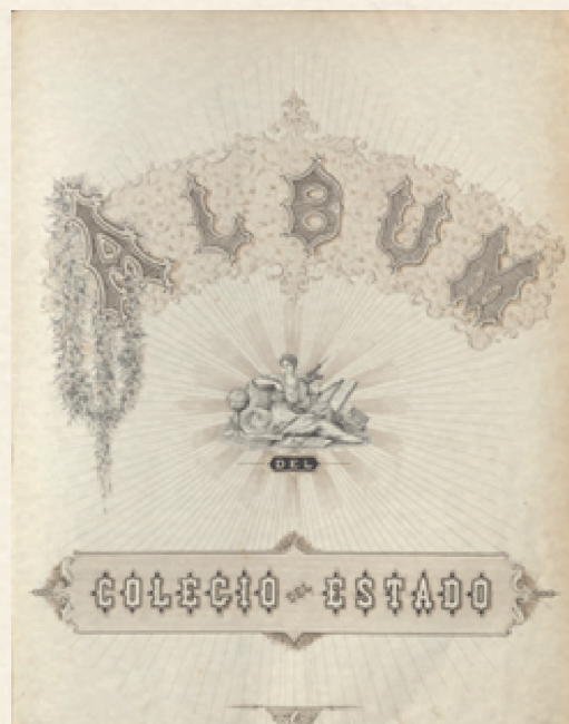
Figura 1. Detalle de la portada del Álbum del Colegio del Estado (1874).